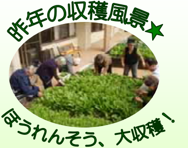
今年の収穫風景★ ほうれんそう、大収穫!