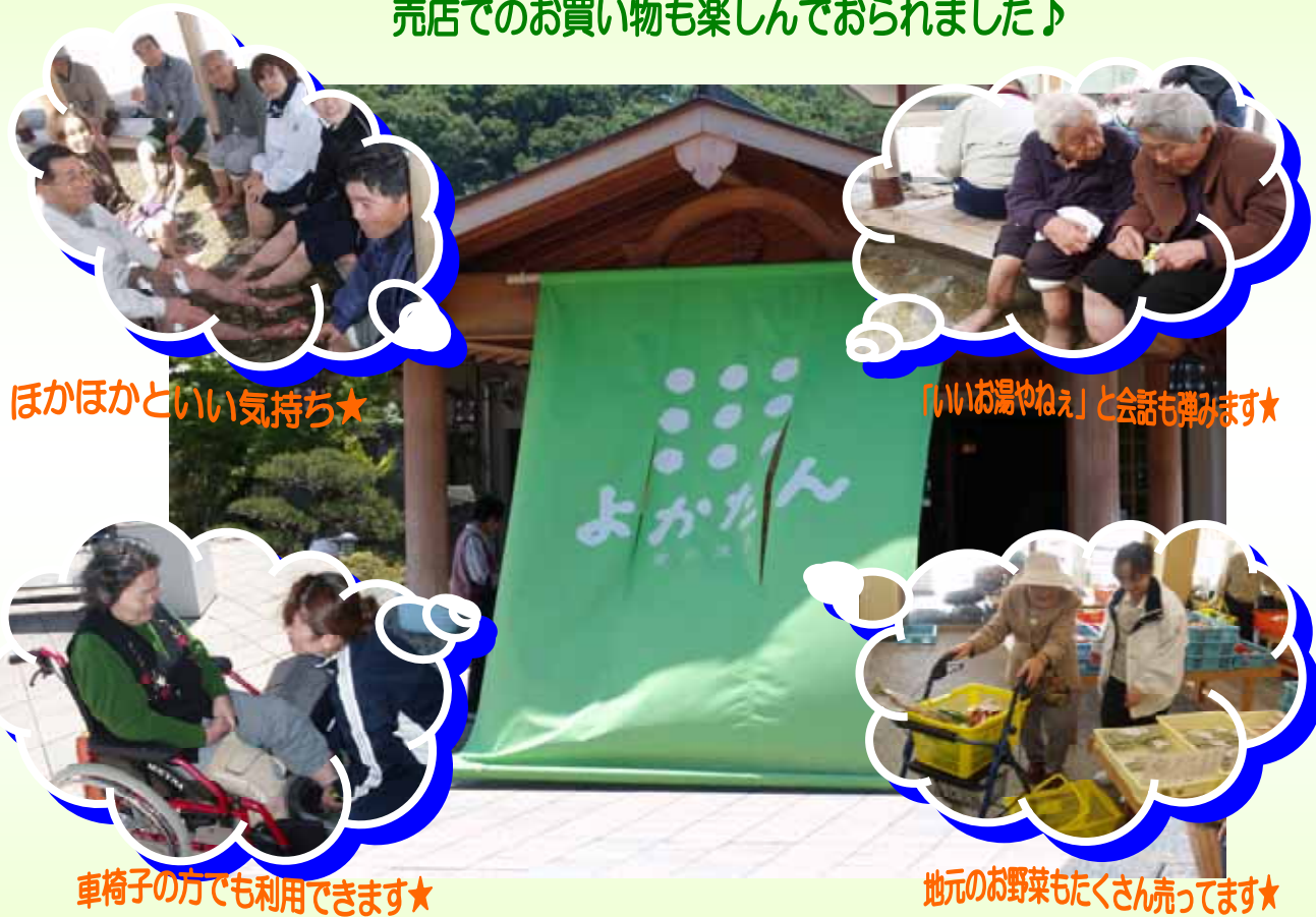
ほかほかといい気持ち★

さわやかな風薫る5月となりました。 今回は、吉川町にある温泉「よかたん」の足湯に行ってきました。 「あったまるわあ〜。」みなさんほんのりといい顔色。 売店でのお買い物も楽しんでおられました♪