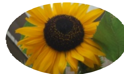
今年も咲きました。 デイケア前花壇

私たちは 地域のみなさまが 自分らしく生きるために 心のこもった医療と介護で 応援します。