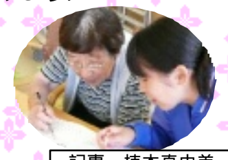
記事・植本真由美