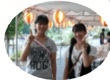
お手伝いに来ました