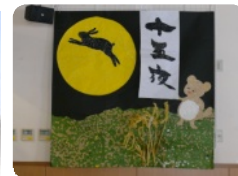
デイケア ちぎり絵製作 「お団子が食べたくなるような作品です」

私たちは 地域のみなさまが 自分らしく生きるために 心のこもった医療と介護で 応援します。