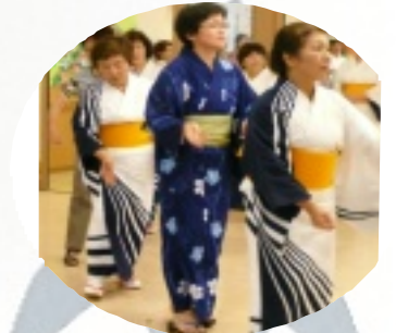
淡河・上淡河婦人会