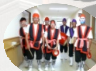
上野丘エイサー隊